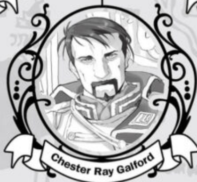
Chester Ray Galford

Faltra's Governor. A Human soldier, and a war hero who participated in the war against the Demon Lord's Army thirty years ago.